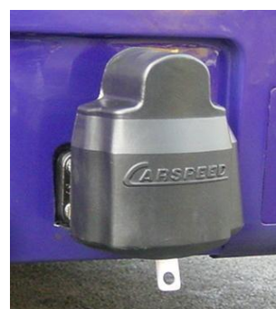
Capot de protection